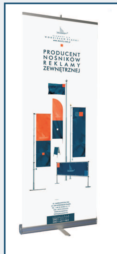
Roll Up ECO

◀ 4 cm margines - miejsce niewidoczne, traktować jak spad